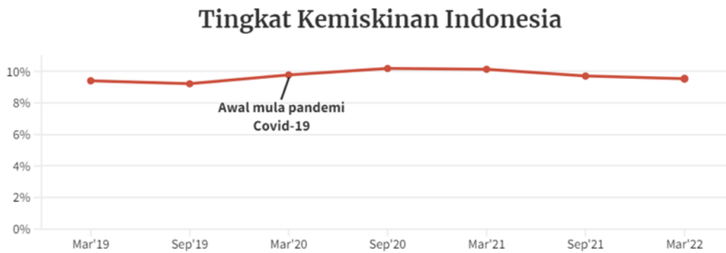
Gambar 1. Data Kemiskinan di Indonesia terdampak COVID-19

Dalam berbagai perspektif ekonomi, banyak cara yang dapat dilakukan oleh Negara untuk mendapatkan anggaran yang digunakan untuk melakukan pembangunan, salah satunya melalui investasi (Auliani et al., 2019). Investasi adalah menempatkan dana pada satu atau lebih pada sebuah aset yang dikelola dengan tujuan untuk mendapatkan keuntungan di masa yang akan datang (Owen & Walter, 2017). Sebuah Negara biasanya melakukan investasi kepada Negara lain dengan tujuan mendapatkan pendapatan dari Negara yang diberi investasi yang biasanya dalam bentuk infrastruktur dan industri.